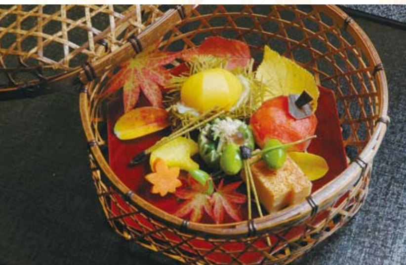
爽り秋満載の八寸。ほど良く熟成されたひやおろしがおすすです。